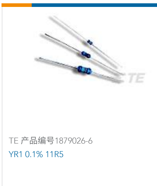
TE 产品编号1879026-6 YR1 0.1% 11R5