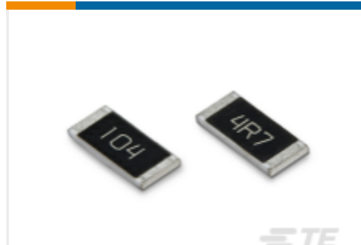
TE 产品编号2-2176455-5 CPF 0402 7R5 0.1% 25ppm 1K RL