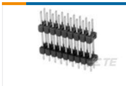
TE 产品编号5-146496-2 04 MODII HDR DRST UNSHRD STKG