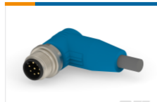
TE 产品编号T4161220008-004 RPC-M12-MR-8CON-PUR-3.0SH