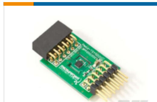
TE 产品编号DPP202Z000 PMD0_TSYS02D