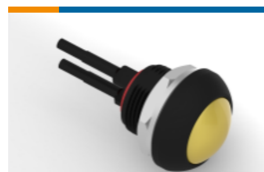
TE 产品编号2329362-3 PB OFF/ON RC YLW M1 TERM IP68 500MM LHS