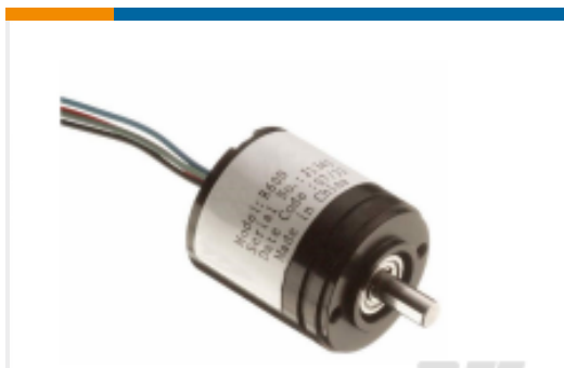
TE 产品编号02192500-060 R60D