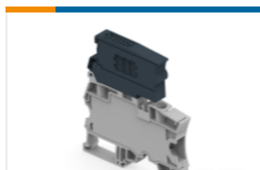
TE 产品编号1SNK508421R0000 ZS10-SF-R1