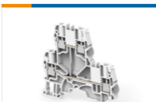
TE 产品编号1SNK505211R0000 ZS4-D1