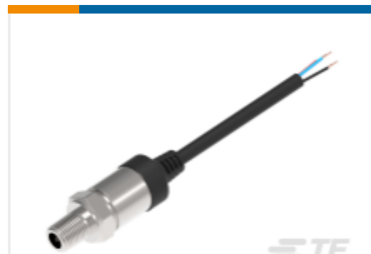
TE 产品编号20014203-12 PRESS XDCR M325M-000005-250PG