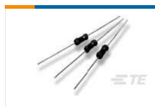
TE 产品编号1-1625893-3 5W SM M/OX 2% 22R