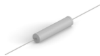
TE 产品编号9-2176415-0 8W STD M/OX 5% 150K