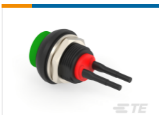
TE 产品编号2329359-9 PB ON/OFF HC GRE M1 TERM IP68 500MM LHS