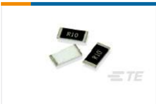
TE 产品编号2-1879461-5 RL73H 2A R13 1% 1K RL