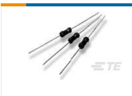
TE 产品编号1-1625893-3 5W SM M/OX 2% 22R