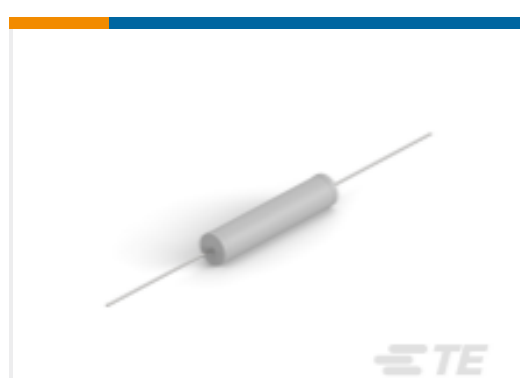
TE 产品编号9-2176415-0 8W STD M/OX 5% 150K