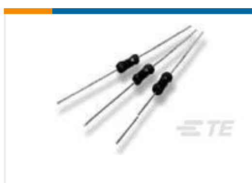
TE 产品编号1-1625893-3 5W SM M/OX 2% 22R