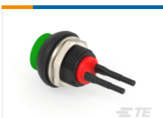
TE 产品编号2329359-9 PB ON/OFF HC GRE M1 TERM IP68 500MM LHS