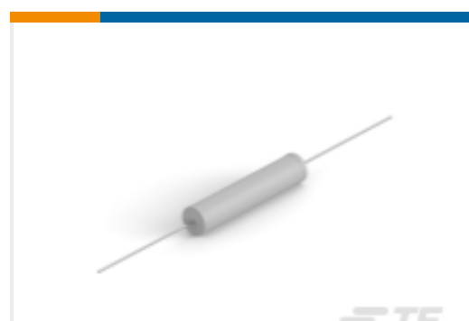
TE 产品编号9-2176415-1 8W STD M/OX 5% 160K