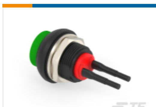
TE 产品编号2329359-9 PB ON/OFF HC GRE M1 TERM IP68 500MM LHS