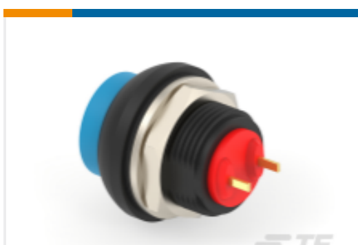
TE 产品编号2-2329328-0 PB OFF/ON HC BLU M4 TERM. IP68