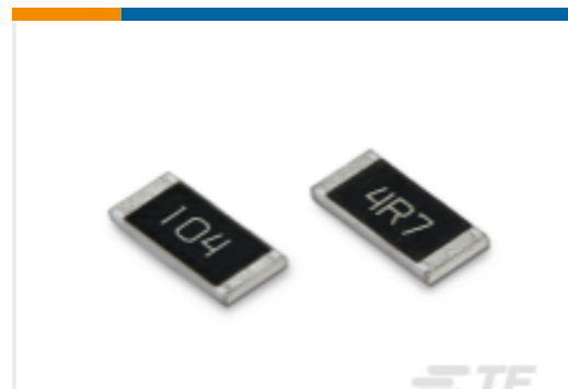
TE 产品编号2-2176455-5 CPF 0402 7R5 0.1% 25ppm 1K RL