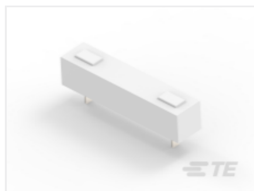
TE 产品编号 1879556-6 SQH40 40R 5% (WIRE) 6.35MM FASTON