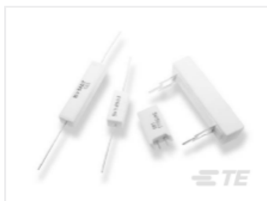
TE 产品编号 CAT-C339-SQ1 线绕电阻器：垂直安装