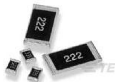
TE 产品编号 6-1879501-0 CRGH2512 5% 300R 2W