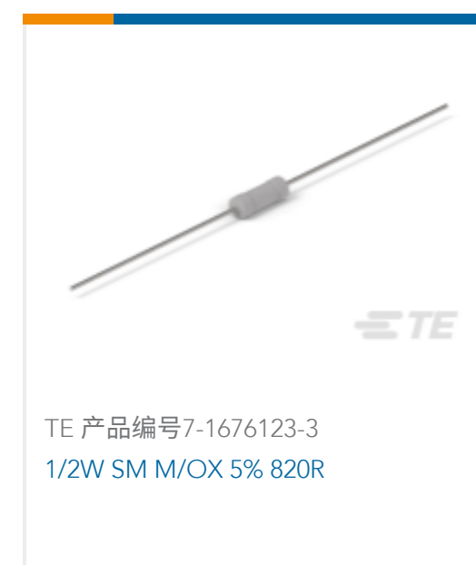
TE 产品编号7-1676123-3 1/2W SM M/OX 5% 820R