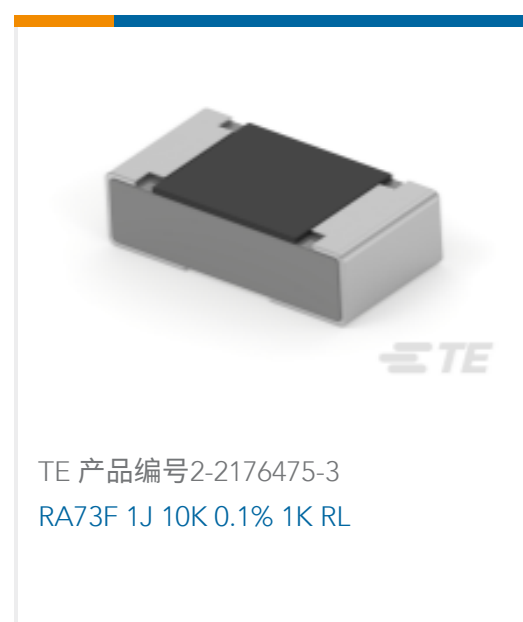
TE 产品编号2-2176475-3 RA73F 1J 10K 0.1% 1K RL