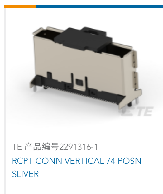
TE 产品编号2291316-1 RCPT CONN VERTICAL 74 POSN SLIVER