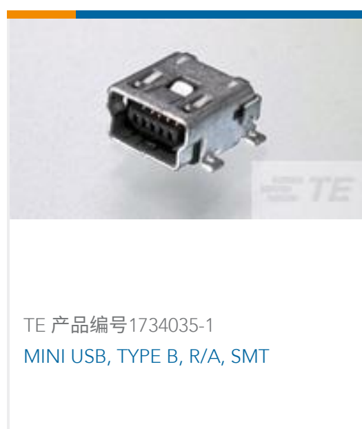
TE 产品编号1734035-1 MINI USB, TYPE B, R/A, SMT