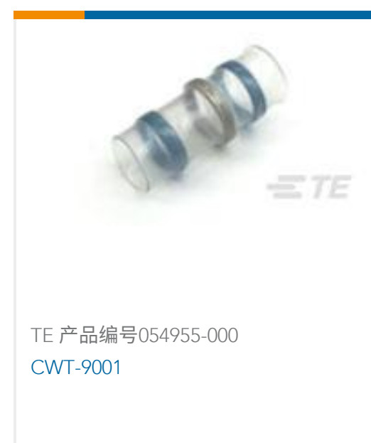
TE 产品编号054955-000 CWT-9001