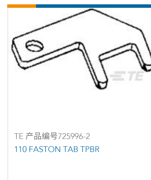
TE 产品编号725996-2 110 FASTON TAB TPBR