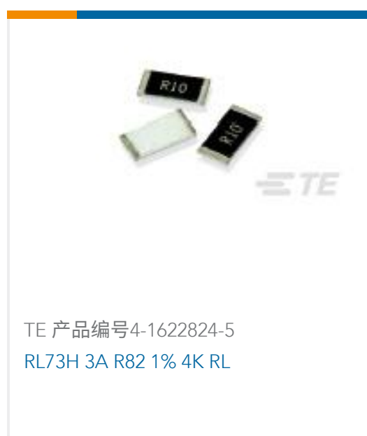
TE 产品编号4-1622824-5 RL73H 3A R82 1% 4K RL