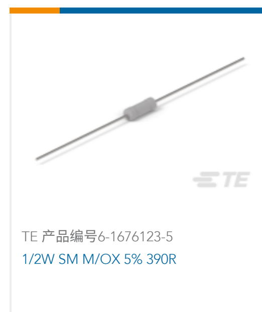
TE 产品编号6-1676123-5 1/2W SM M/OX 5% 390R