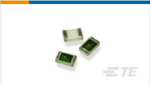
TE 产品编号8-1676481-2 CPF 0603 20K 0.1% 25PPM 1K RL