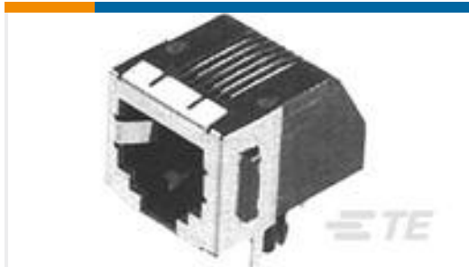
TE 产品编号5555140-1 MJ,LPF,R/A,6P/6C,SHLD,PNL GRD