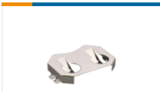
TE 产品编号BAT-HLD-001 Battery Holder 2032 2025 SMT Bulk Pack