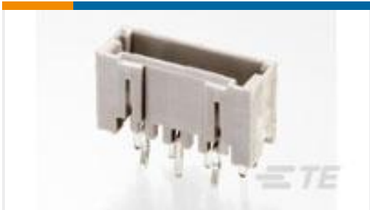
TE 产品编号292207-8 MINI CT SGL DIP V 8P NAT