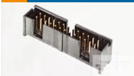
TE 产品编号5103309-2 A/L LOW PRO HDR 14P VERT BLACK