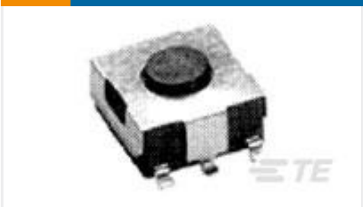
TE 产品编号1-1437565-8 FSM1LPATR=TACT SWITCH 6X6MIL S