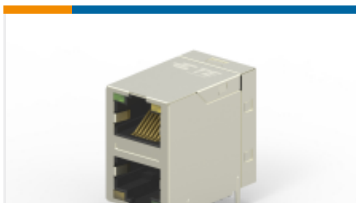
TE 产品编号2301997-7 RJ45 JACK INT.MAG. 1GB LED 2X1