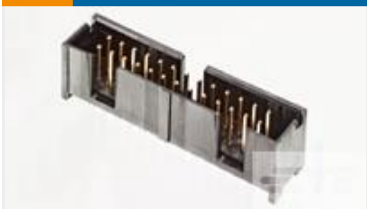
TE 产品编号5103309-1 A/L LOW PRO HDR 10P VERT BLACK