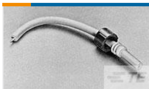
TE 产品编号1-830611-0 LGH 1/2 SNGL MLD END