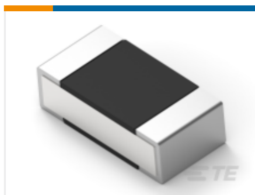
TE 产品编号7-2176305-3 RP 1E 0.1W 604R 0.1% 25PPM 5K RL