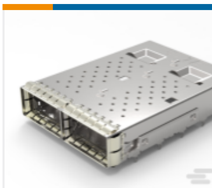
TE 产品编号2300281-1 CAGE ASSEMBLY, 1X2, QSFP28, SPRING