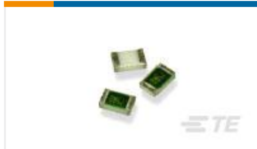
TE 产品编号2-1879215-2 CPF 0402 6K65 0.1% 25PPM 1K RL