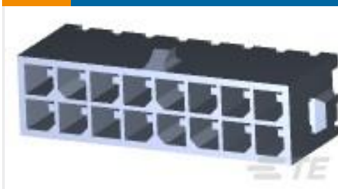
TE 产品编号4-794630-6 16P MICRO MNL ASSY,VRT,HDR,LF