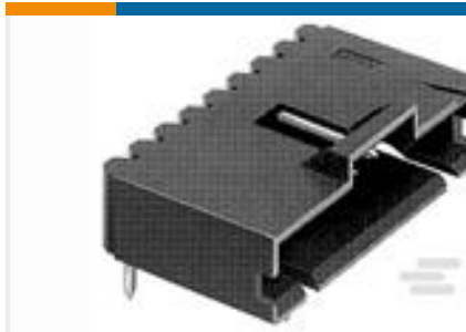
TE 产品编号5-103635-1 02 MTE HDR SRRA LTCH.100CL LF