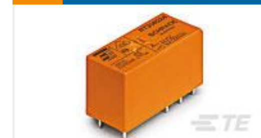
TE 产品编号1-1419108-7 RT424024F