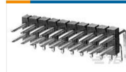
TE 产品编号826953-5 5P MOD2 STIFT LEI