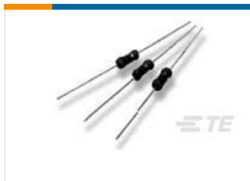
TE 产品编号1879352-6 RR02 5% R51 AMMO