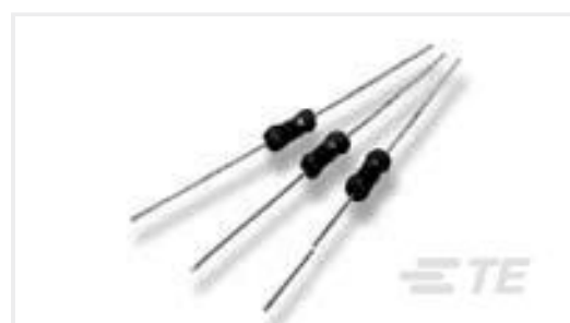
TE 产品编号 6-1879354-6 RR03 5% 160R AMMO