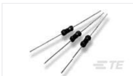
TE 产品编号 7-1879352-7 RR02 5% 470R AMMO