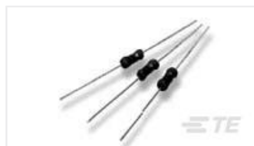
TE 产品编号 5-1879352-5 RR02 5% 56R AMMO