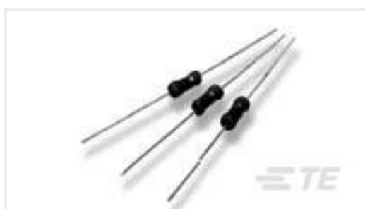
TE 产品编号 6-1879354-6 RR03 5% 160R AMMO