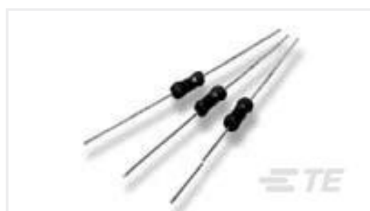
TE 产品编号 4-1879350-9 RR01 5% 22R AMMO