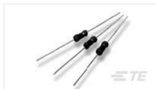
TE 产品编号 5-1879352-5 RR02 5% 56R AMMO