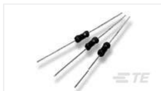
TE 产品编号 7-1879352-7 RR02 5% 470R AMMO