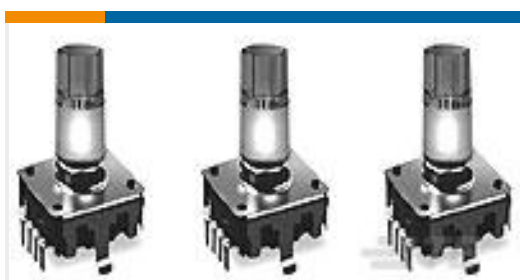
TE 产品编号 1-1879314-1 DPL12 24P NDET 20F BLUE