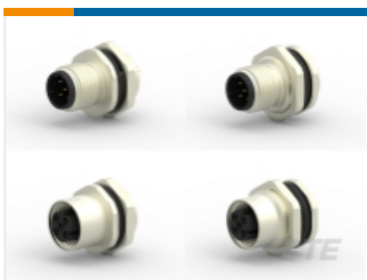
TE 产品编号T4133012051-000 M12 面板安装焊杯