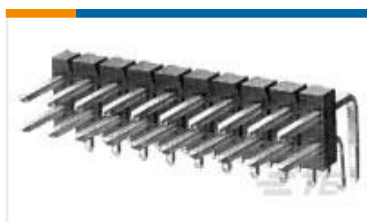
TE 产品编号826662-4 4P AMPMODU II STIFT LEI