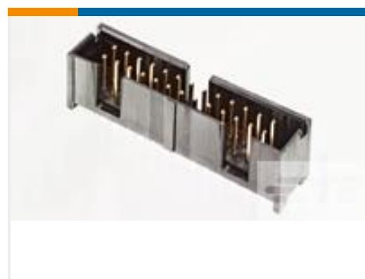
TE 产品编号2-1761603-9 IDC LOW PRO HDR 26P VERT BLUE