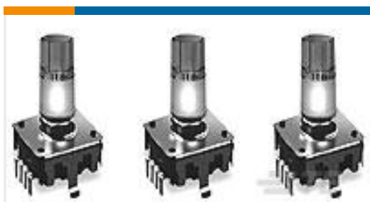
TE 产品编号 1-1879314-1 DPL12 24P NDET 20F BLUE