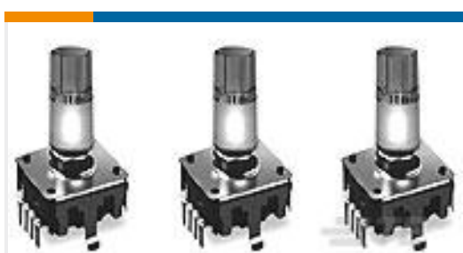
TE 产品编号 1-1879749-7 LED ENCODER 12MM HORIZ SW GR /RD