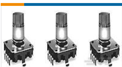
TE 产品编号 4-1879314-7 DPL12S 24P 24DET 21F RD/GRN