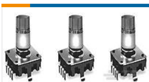
TE 产品编号 2-1879749-3 LED ENCODER 12MM HORIZ SW GR /RD