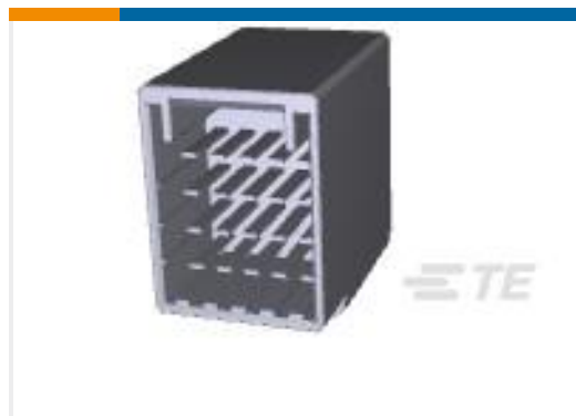
TE 产品编号917251-2 DYNAMIC D-3400F HDR ASSY 20P H