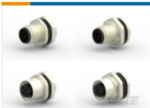
TE 产品编号T4133012051-000 M12 面板安装焊杯