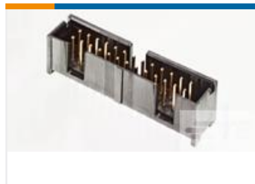
TE 产品编号2-1761603-9 IDC LOW PRO HDR 26P VERT BLUE