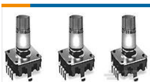
TE 产品编号 4-1879314-5 DPL12S 24P 24DET 25K RD/GRN