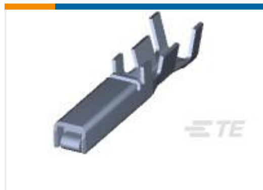
TE 产品编号175196-3 DYNAMIC D-3 REC CONT/L AU 0.76