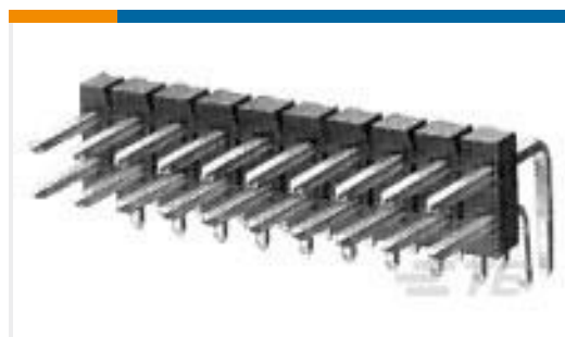
TE 产品编号826662-4 4P AMPMODU II STIFT LEI