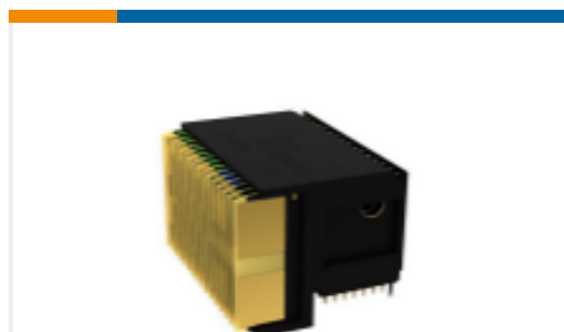
TE 产品编号1410326-3 MULTIGIG RT T2 7RW DC DF CT