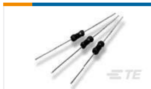
TE 产品编号1879352-1 RR02 5% R33 AMMO