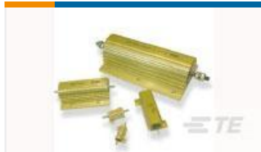
TE 产品编号2-1630186-7 HSA50 5R1 5%