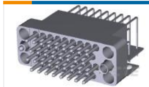
TE 产品编号213289-2 V.35,PIN ASY,RA,34P,W/BRKT LF