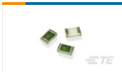
TE 产品编号1676328-2 RN 0805 3K4 0.1% 10PPM 1KRL