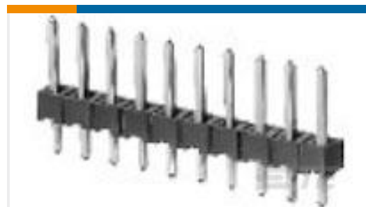
TE 产品编号5-146278-3 03 MODII HDR SRST B/A .100CL