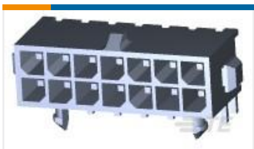
TE 产品编号4-794618-4 14P MICRO MNL ASSY R/A HDR LF