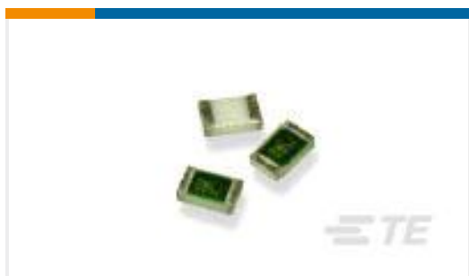
TE 产品编号3-1879216-0 CPF0402 120K 0.1% 25PPM 1K RL