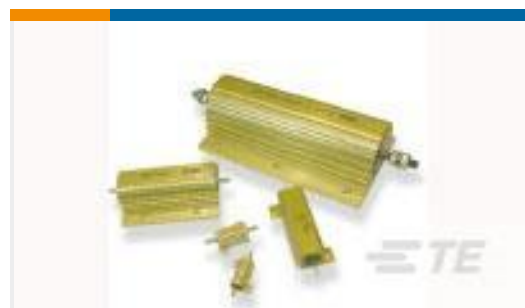
TE 产品编号2-1630024-1 HSC250 R47 5%