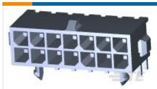
TE 产品编号4-794620-4 14P MICRO MNL ASSY,R/A,HDR,LF