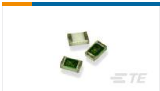
TE 产品编号1614959-9 CPF0805 1M2 0.1% 25PPM 1K RL