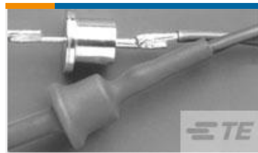
TE 产品编号5677564008 RNF-3000-3/1-0-SP