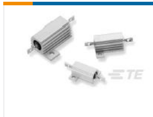
TE 产品编号1-1879073-0 THS10 1R0 5%