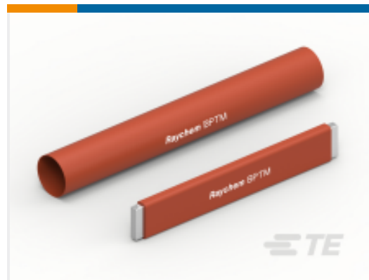
TE 产品编号723955-000 母线热缩管高达 24 kV