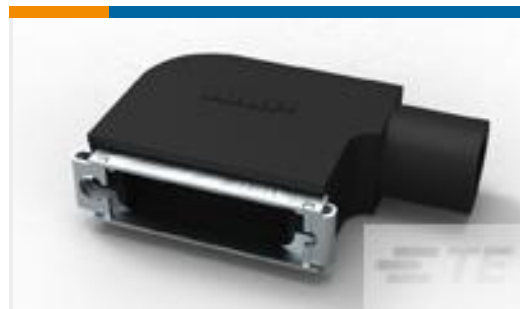
TE 产品编号5745652-2 DIECAST STRAIN RELIEF KIT,SZ 2