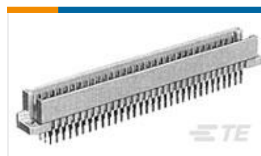
TE 产品编号5650923-5 ASSY,PIN,EUROCARD,TYPE R,LEAD-FREE,150 P