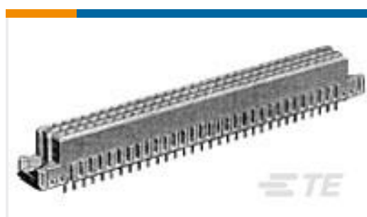
TE 产品编号5535071-4 ASSY,RECEPTACLE,EUROCARD,TYPE