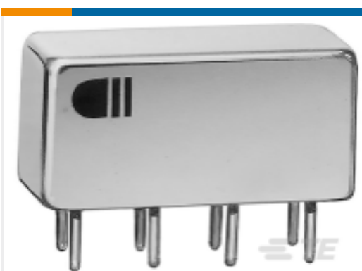
TE 产品编号6-1617347-6 3SBC1723A2=M39016/38-023M