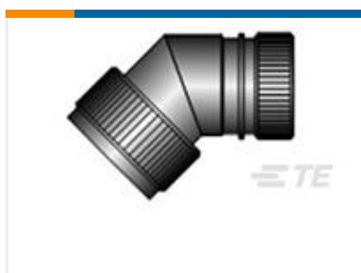
TE 产品编号CZ6862-000 HEX40-AC-45-25-A12-3