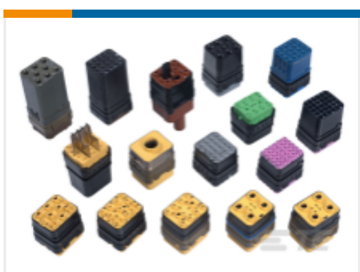
TE 产品编号ZPF000000000202094 DMC-M 0402 AW 01