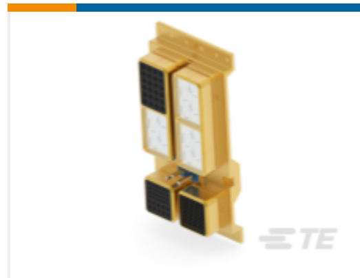
TE 产品编号1875131-2 ARINC 600, Size 3, Plug Assembly