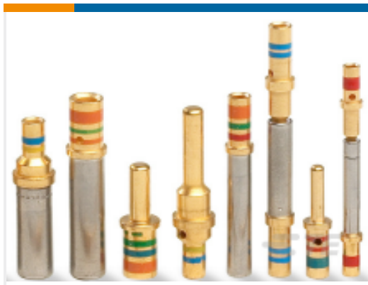
TE 产品编号2560-201-2031L CONT PIN