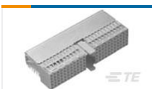
TE 产品编号5100147-1 Z-PACK/A RAF 110P