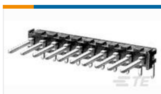
TE 产品编号1-87233-0 10 MODII HDR SRRA UNSHRD .100