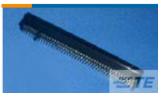
TE 产品编号 1734774-1 PCI EXP 3.1L 36 POS WHT G/F