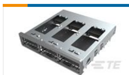
TE 产品编号2173238-1 1x3 Cage Assy, Bhnd Bezel, QSFP28