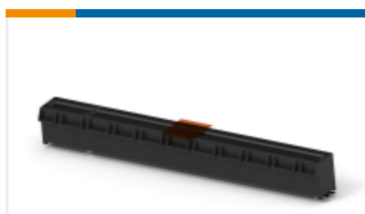
TE 产品编号 5-2337939-4 PCIE GEN4 CON,SMT,164POS,30u", MYLAR,HT