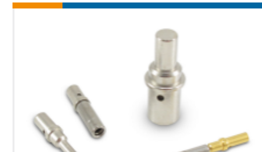
TE 产品编号0460-202-16141 DEUTSCH Solid Contacts