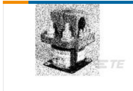
TE 产品编号1616055-3 A1077DD (FAA/PMA)=CONTACTOR - S.P.S.T.