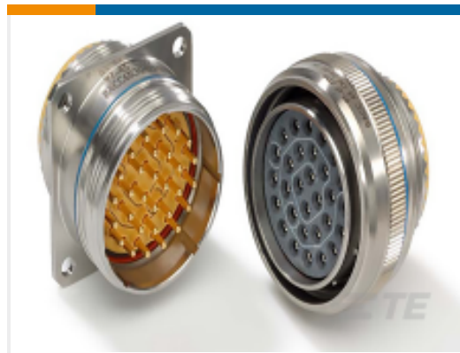
TE 产品编号ZPF000000000033725 983-0SE 18-08 PN-L