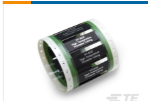
TE 产品编号1827990001 HT-SCE High Temperature Sleeves