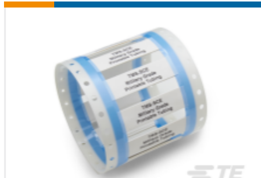
TE 产品编号4397130001 TMS-SCE Military Grade Sleeves