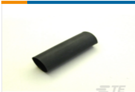
TE 产品编号241165-000 单壁 RT 1145 : 热缩管