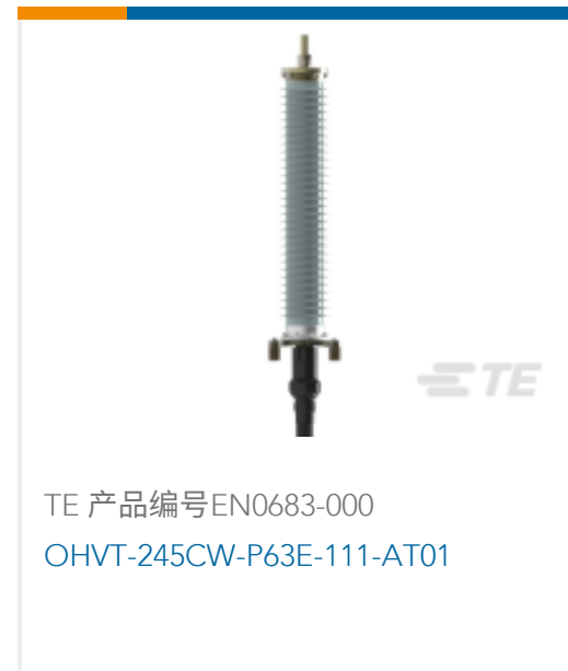
TE 产品编号EN0683-000 OHVT-245CW-P63E-111-AT01