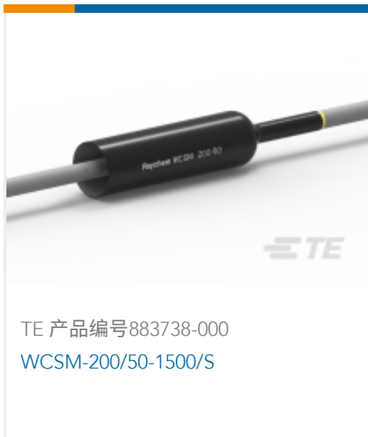
TE 产品编号883738-000 WCSM-200/50-1500/S