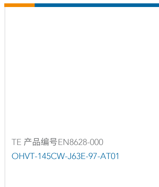
TE 产品编号EN8628-000 OHVT-145CW-J63E-97-AT01