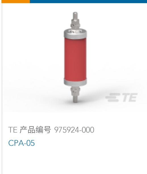
TE 产品编号 975924-000 CPA-05