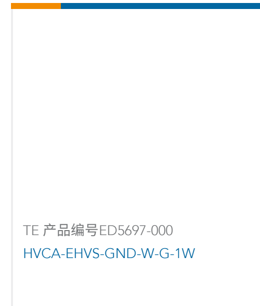
TE 产品编号ED5697-000 HVCA-EHVS-GND-W-G-1W