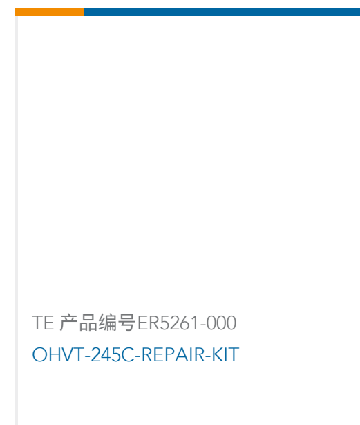
TE 产品编号ER5261-000 OHVT-245C-REPAIR-KIT