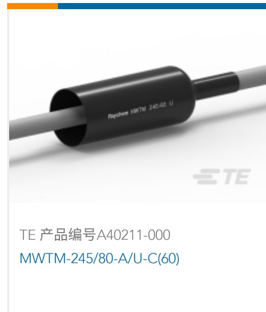
TE 产品编号A40211-000 MWTM-245/80-A/U-C(60)