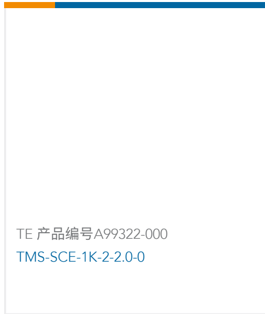
TE 产品编号A99322-000 TMS-SCE-1K-2-2.0-0