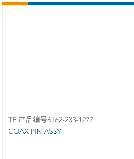
TE 产品编号6162-233-1277 COAX PIN ASSY