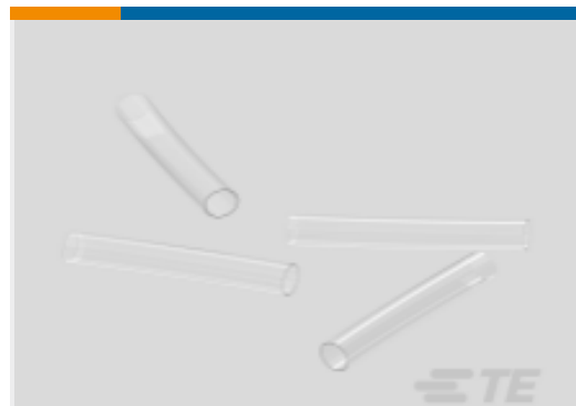
TE 产品编号NB16104001 RT-375-3/8-X-SP