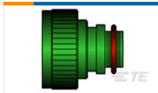
TE 产品编号931957-000 TXR40AB00-2414AI