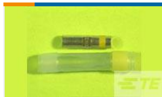
TE 产品编号650083-000 D-436-59