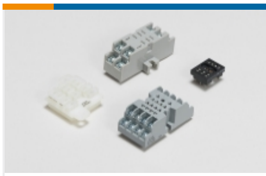
继电器附件、插座和卡箍(33)