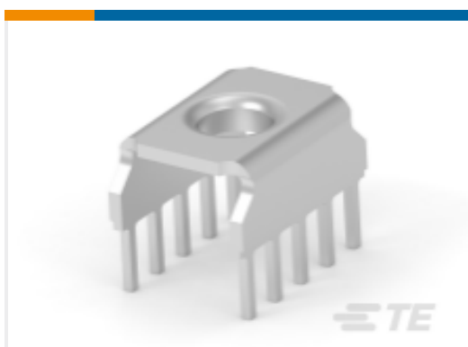
TE 产品编号214782-E EPSVA KS GDM4 EE 10 3,8 SN * STROMVERSOR