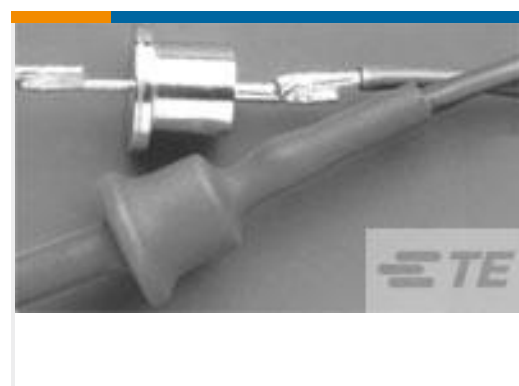
TE 产品编号4769632004 RNF-3000-6/2-3-STK