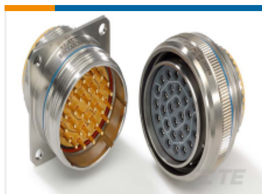
TE 产品编号ZPF00000000007489 983-0SE 10-05 PN