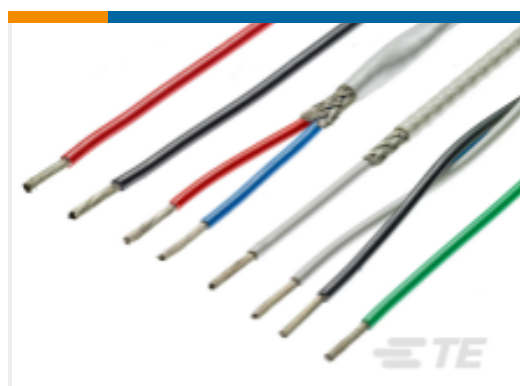
TE 产品编号2813563001 44/7031-16-2