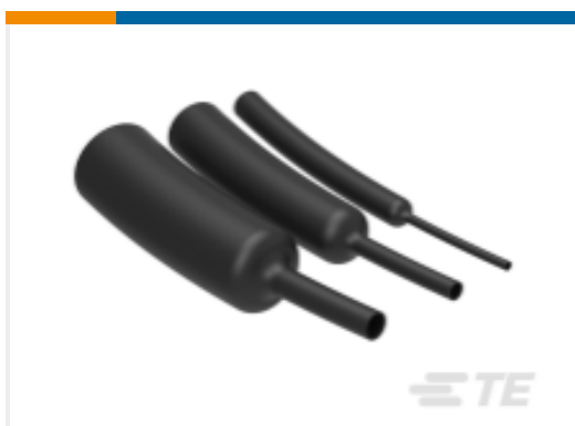
TE 产品编号5677912004 RNF-3000 Heat Shrink Tubing