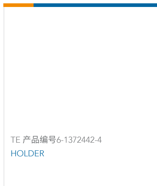
TE 产品编号6-1372442-4 HOLDER