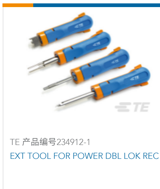
TE 产品编号234912-1 EXT TOOL FOR POWER DBL LOK REC