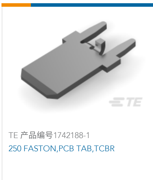
TE 产品编号1742188-1 250 FASTON,PCB TAB,TCBR