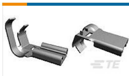
TE 产品编号41531-1 250 FASTON FLAG REC 18-12 AWG NPST