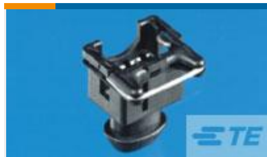
TE 产品编号281844-1 BOIT PORTE-CLIP 2P