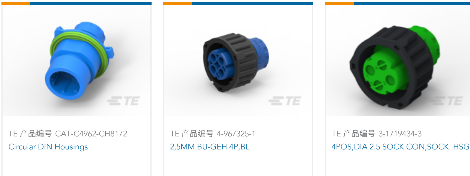
TE 产品编号 CAT-C4962-CH8172 Circular DIN Housings