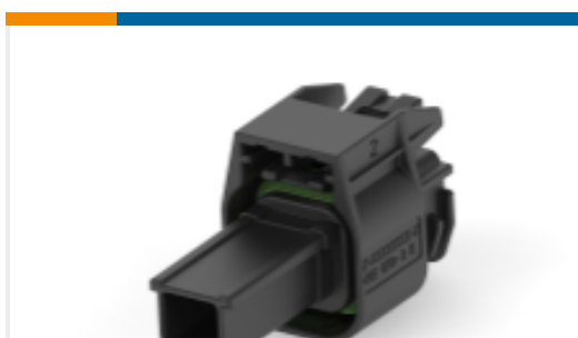
TE 产品编号2348651-1 BLIND PLUG SEALED, MATENET, ASSY