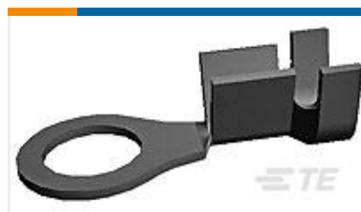
TE 产品编号41346 RING TERMINAL 18-14 AWG NPSTL