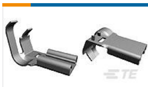
TE 产品编号60641-1 250 FASTON FLAG REC 18-12 AWG BR