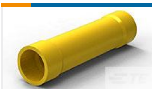
TE 产品编号2-34072-2 SPLICE,PG BUTT 12-10