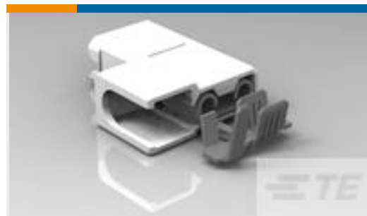
TE 产品编号520971-4 ULTRA-POD 250 ASY REC 18-14 AWG TPBR