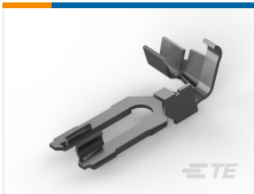
TE 产品编号 926770-1 MT.EDGE CRIMP CONT.