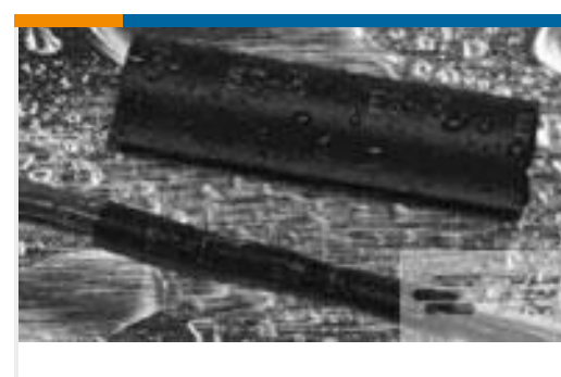
TE 产品编号CX2740-000 ES2000-NO.3-B8-0-130MM