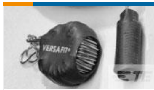
TE 产品编号CV7081-000 VERSAFIT-3/4-0-0.5IN