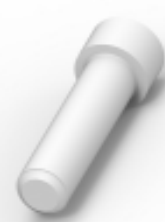
TE 产品编号114017-ZZ SEALING PLUG, SIZE 12/16, WHT