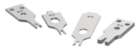
CRIMPER REPRESENTATION ONLY