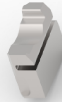
TE 产品编号 318059-1 FLOATING SHEAR