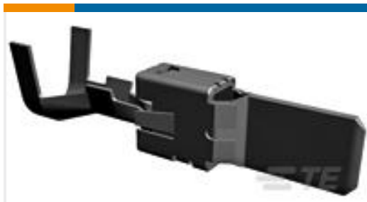
TE 产品编号 963774-1 TAB 9.5x1.2 CONTACT CS SWS Sn