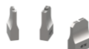
ANVIL REPRESENTATION ONLY