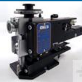
TE 产品编号2150393-2 OCEAN_2.0_Applicator-E-170F224FA