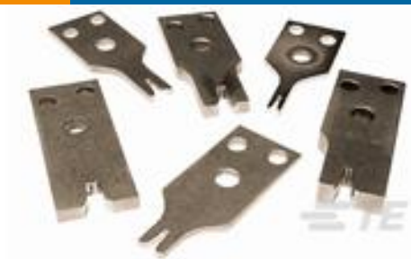
TE 产品编号3-459492-9 CRIMPER, WIRE "O"