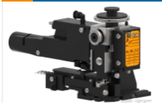
TE 产品编号2836052-2 OCEAN_2.0_Applicator-S-217F323OV