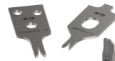
KIT REPRESENTATION ONLY