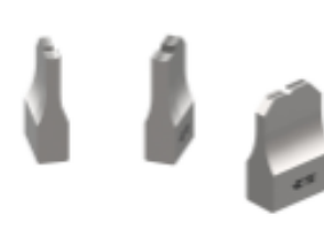
ANVIL REPRESENTATION ONLY