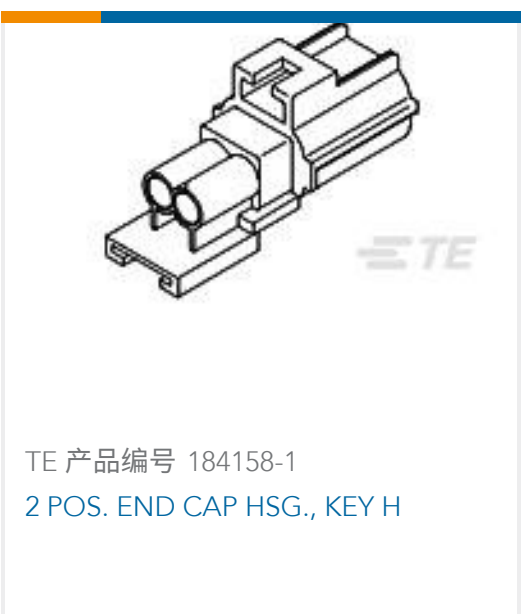
TE 产品编号 184158-1 2 POS. END CAP HSG., KEY H