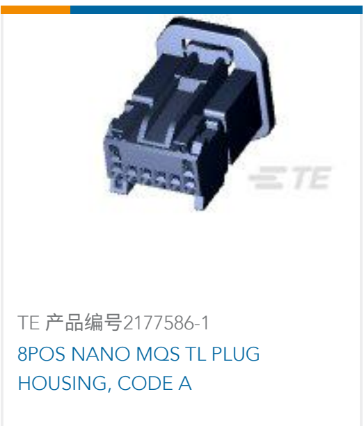
TE 产品编号2177586-1 8POS NANO MQS TL PLUG HOUSING, CODE A