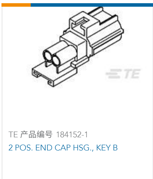
TE 产品编号 184152-1 2 POS. END CAP HSG., KEY B