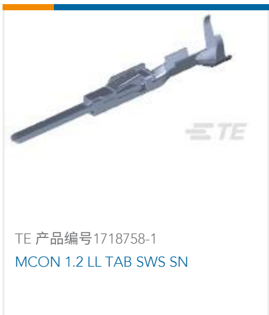
TE 产品编号1718758-1 MCON 1.2 LL TAB SWS SN