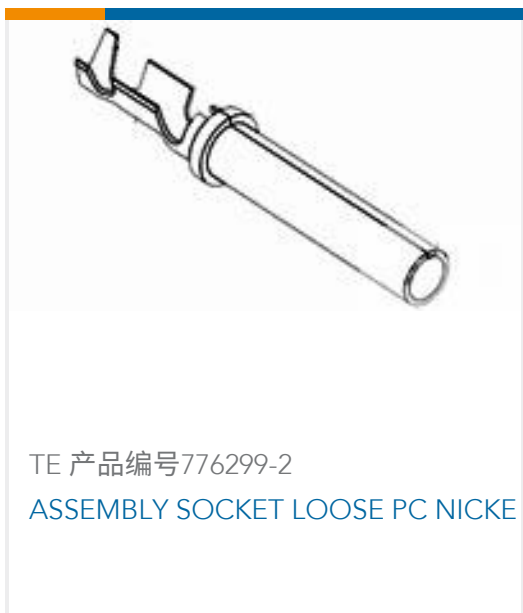
TE 产品编号776299-2 ASSEMBLY SOCKET LOOSE PC NICKE