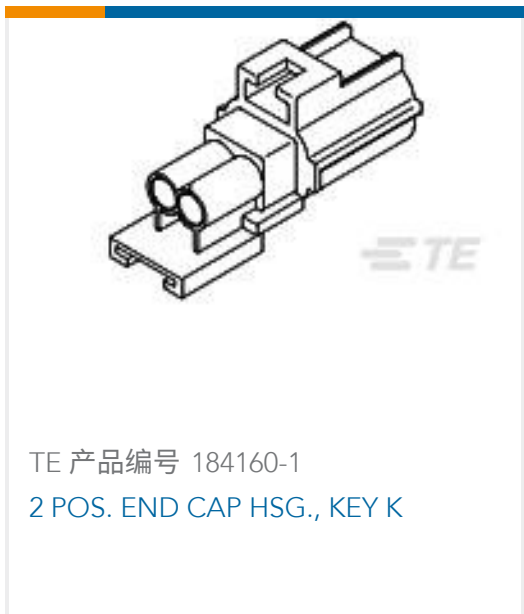
TE 产品编号 184160-1 2 POS. END CAP HSG., KEY K