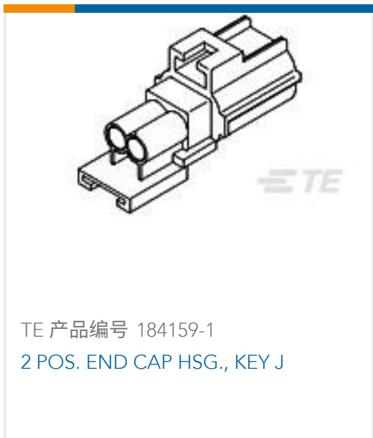
TE 产品编号 184159-1 2 POS. END CAP HSG., KEY J