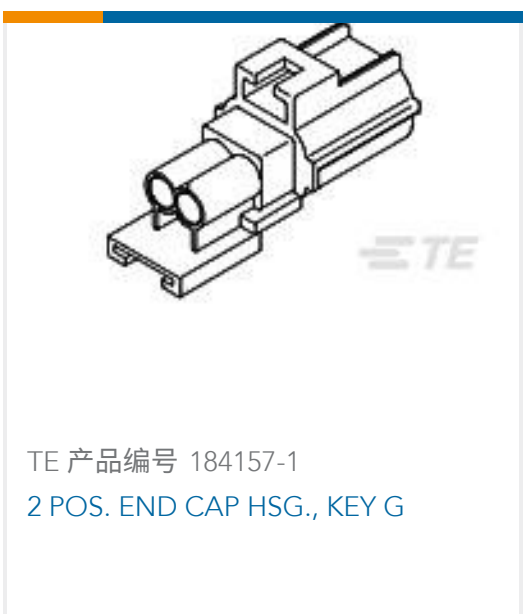
TE 产品编号 184157-1 2 POS. END CAP HSG., KEY G