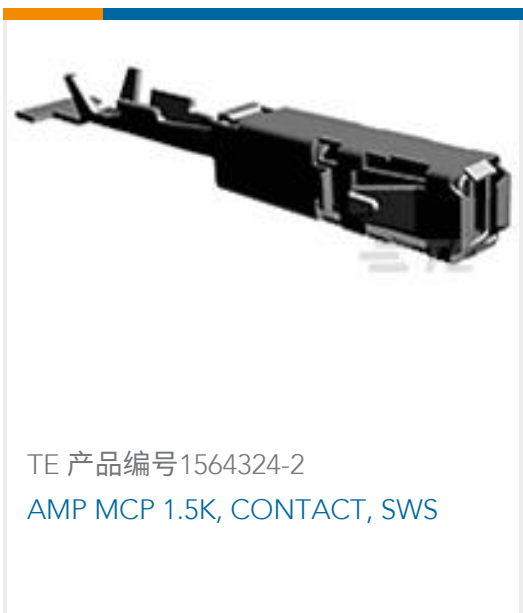
TE 产品编号1564324-2 AMP MCP 1.5K, CONTACT, SWS