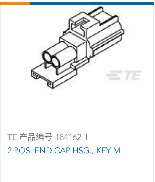
TE 产品编号 184162-1 2 POS. END CAP HSG., KEY M