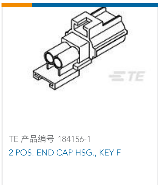
TE 产品编号 184156-1 2 POS. END CAP HSG., KEY F