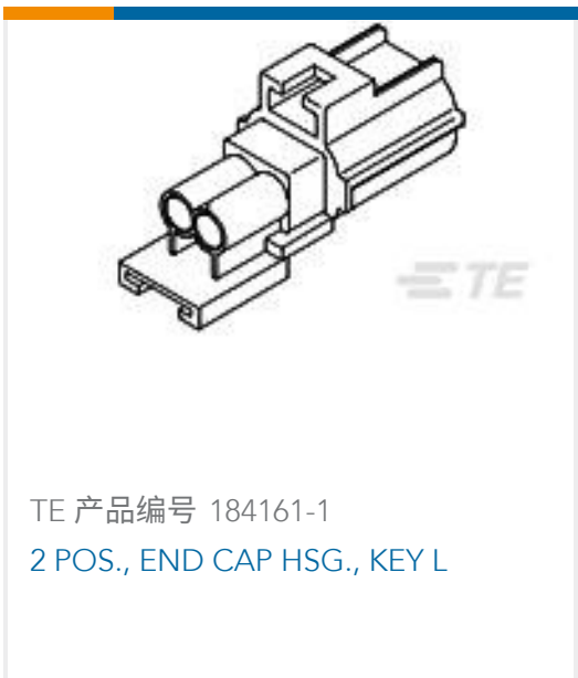
TE 产品编号 184161-1 2 POS., END CAP HSG., KEY L