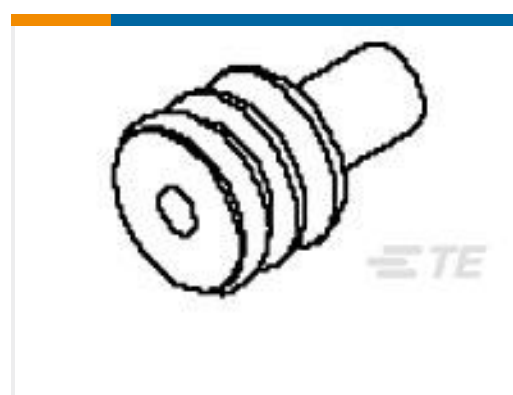
TE 产品编号 184141-1 WIRE SEAL, RUBBER, SENSOR, PURPLE, LIM