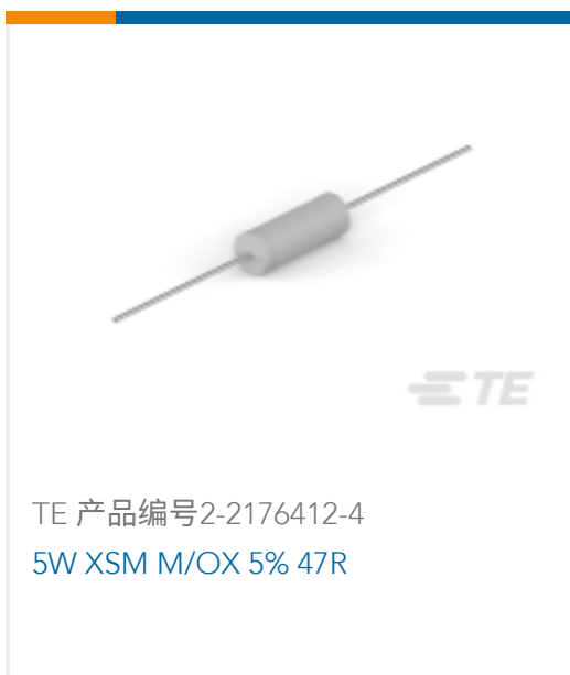
TE 产品编号2-2176412-4 5W XSM M/OX 5% 47R