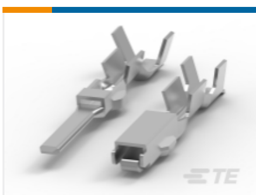
TE 产品编号 CAT-EC7491-T273 Econoseal 母端和公端