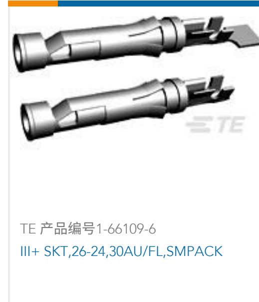
TE 产品编号1-66109-6 III+ SKT,26-24,30AU/FL,SMPACK