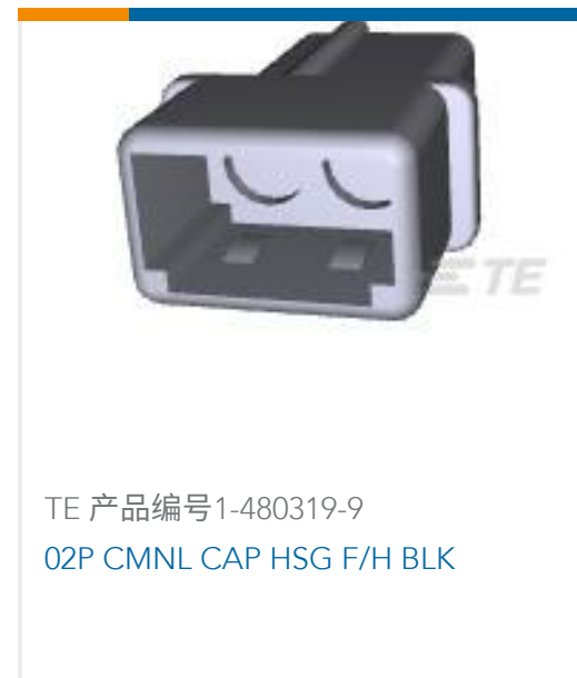
TE 产品编号1-480319-9 02P CMNL CAP HSG F/H BLK