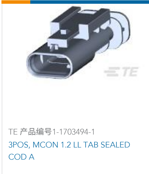
TE 产品编号1-1703494-1 3POS, MCON 1.2 LL TAB SEALED COD A