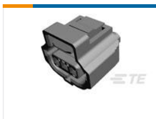
TE 产品编号 184032-1 3 POS. PLUG ASSY, KEY A