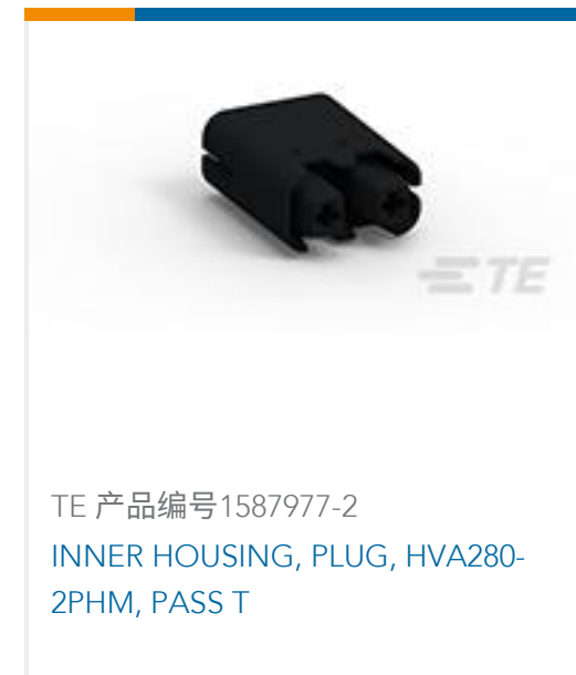
TE 产品编号1587977-2 INNER HOUSING, PLUG, HVA280-2PHM, PASS T