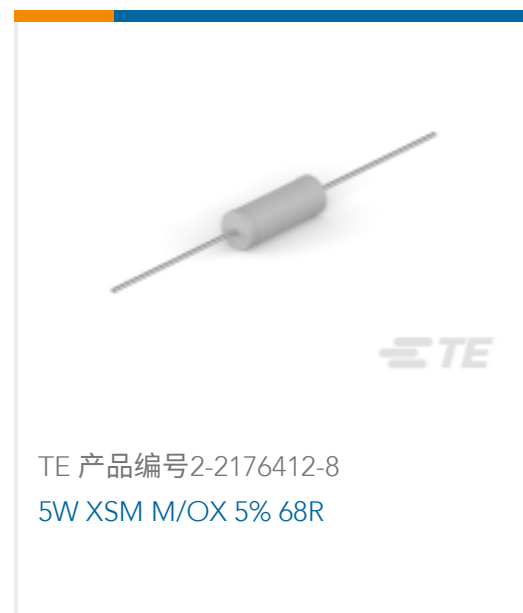
TE 产品编号2-2176412-8 5W XSM M/OX 5% 68R