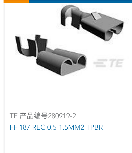
TE 产品编号280919-2 FF 187 REC 0.5-1.5MM2 TPBR