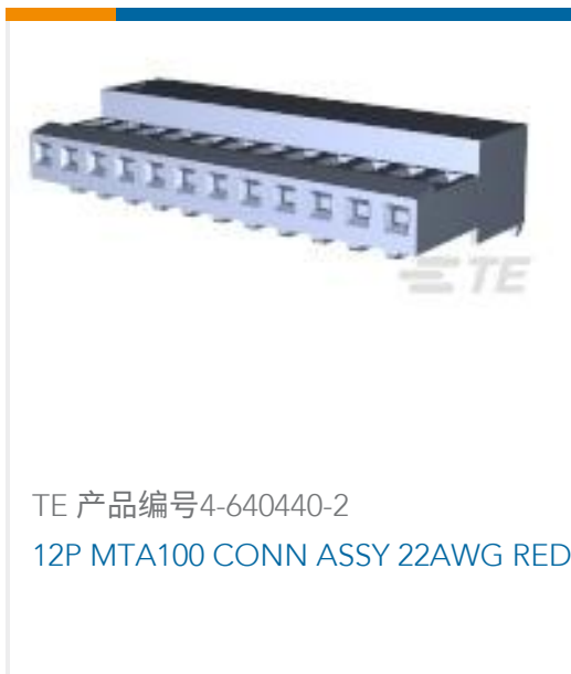
TE 产品编号4-640440-2 12P MTA100 CONN ASSY 22AWG RED