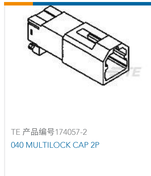
TE 产品编号174057-2 040 MULTILOCK CAP 2P