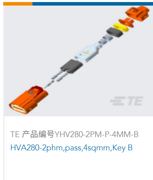
TE 产品编号YHV280-2PM-P-4MM-B HVA280-2phm,pass,4sqmm,Key B