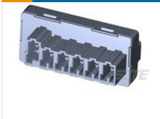
TE 产品编号5-1418637-5 13pos MQS .63 header 180deg