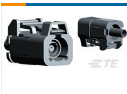
TE 产品编号1-1924792-0 PLUG KIT, UNASSEM, 1 POS, RG-316 OR RG-1