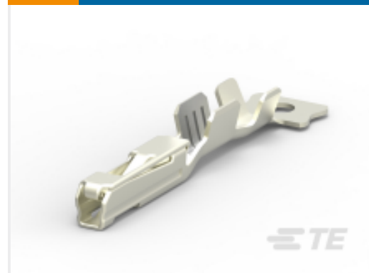
TE 产品编号1326028-6 0.64MM FEMALE CONTACT,AU, 22AWG