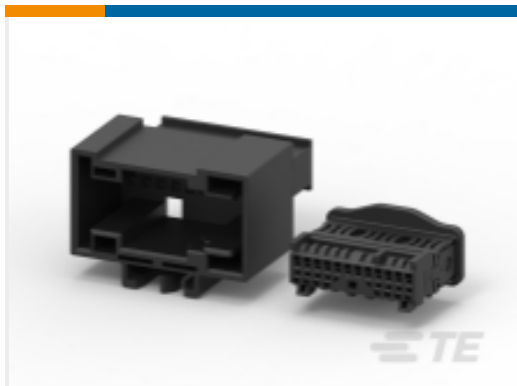
TE 产品编号7-2177543-7 MQS 连接器外壳