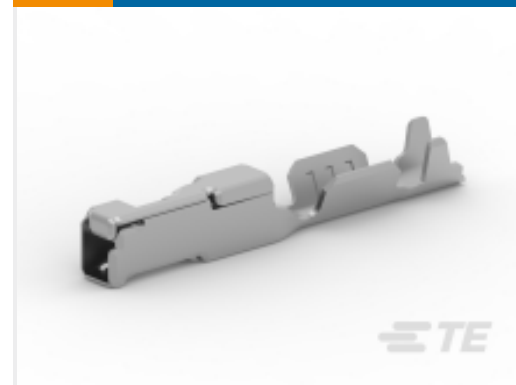
TE 产品编号2035170-8 CONTACT,FEMALE, 0.64, 0.35SQMM, CUNISI