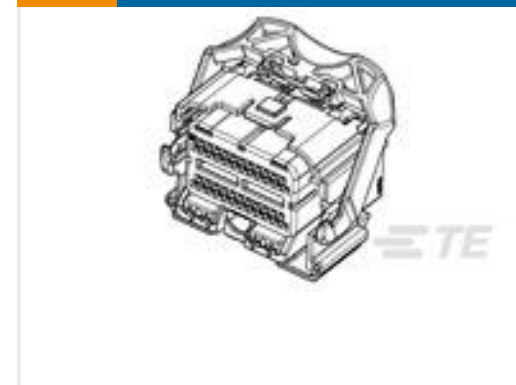
TE 产品编号1438691-1 GET - 50 way PCM, TIPM, plug assy, key A