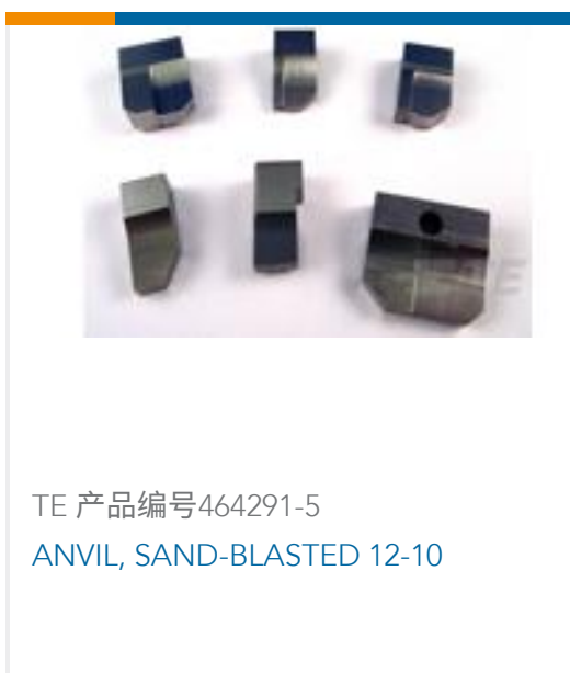
TE 产品编号464291-5 ANVIL, SAND-BLASTED 12-10