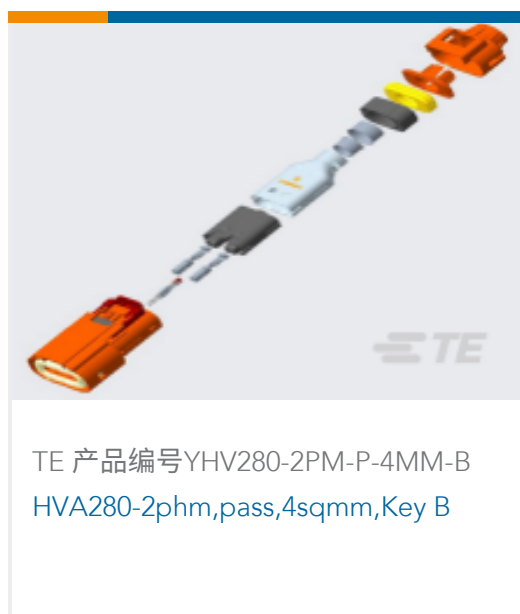
TE 产品编号YHV280-2PM-P-4MM-B HVA280-2phm,pass,4sqmm,Key B