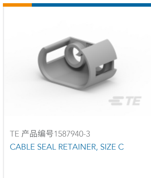
TE 产品编号1587940-3 CABLE SEAL RETAINER, SIZE C