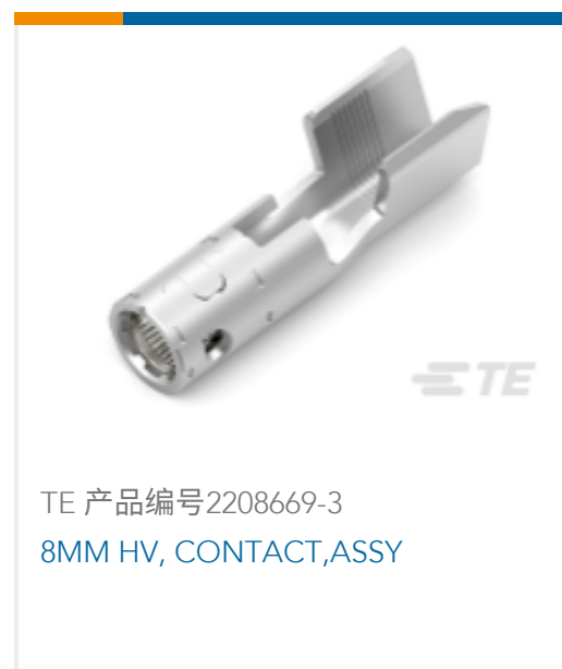
TE 产品编号2208669-3 8MM HV, CONTACT, ASSY