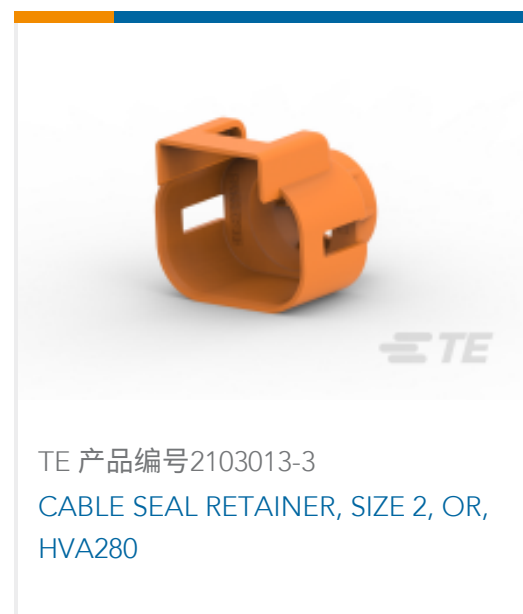
TE 产品编号2103013-3 CABLE SEAL RETAINER, SIZE 2, OR, HVA280