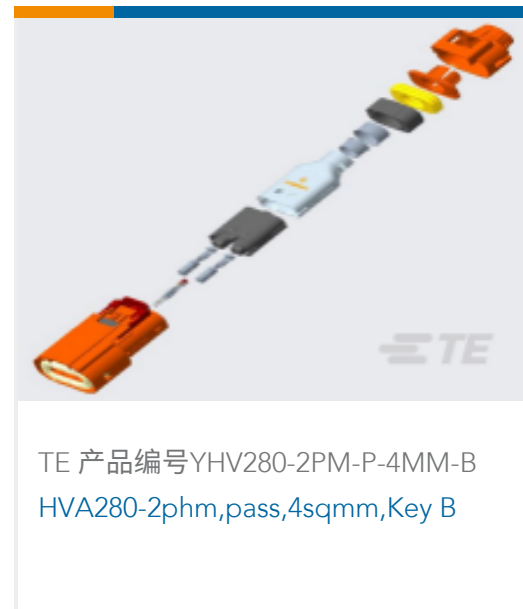
TE 产品编号YHV280-2PM-P-4MM-B HVA280-2pHm,pass,4sqmm,Key B