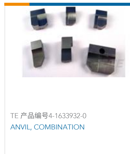
TE 产品编号4-1633932-0 ANVIL, COMBINATION