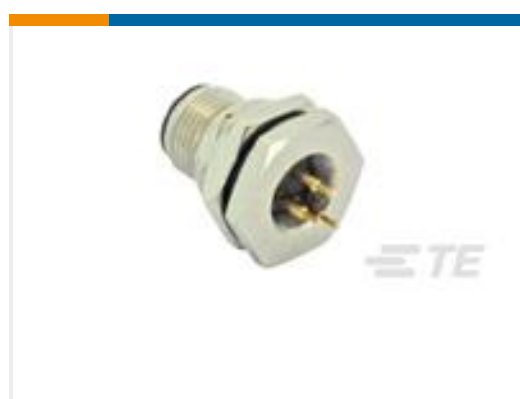
TE 产品编号1838893-3 M12 Mtl MALE PNL CONN. Sldr Re