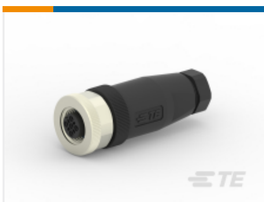
TE 产品编号T4110001031-000 M12,FEMALE,STRAIGHT,A CODE,3P, PG7,GOLD