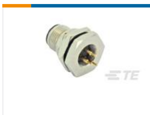
TE 产品编号1838893-2 M12 Mtl MALE PNL CONN. Sldr Rear (Hex)