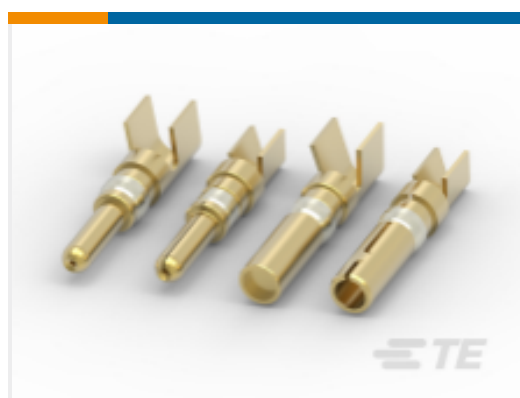
TE 产品编号213847-3 POWERBAND Contacts