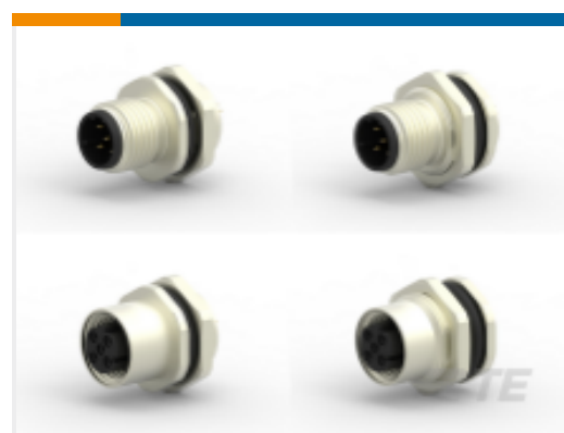
TE 产品编号T4131012041-000 M12 面板安装焊杯