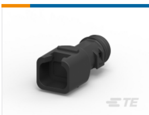
TE 产品编号1011-235-0405 BKSHL, 4P, BLK, PLG, ST, NW6/7.5/8.5 /10