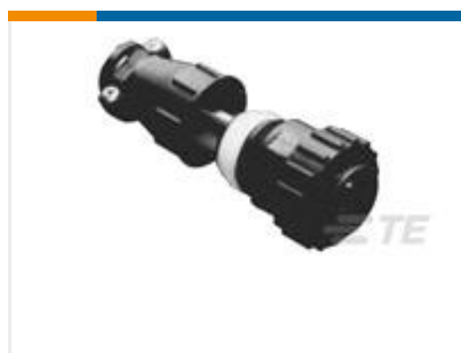
TE 产品编号213889-2 CPC RECPT SEALED,SIZE 17-3