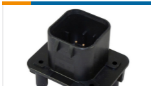
TE 产品编号1-776275-1 8POS,PIN DIA 1.3,HDR ASSY,180DEG, COD 1