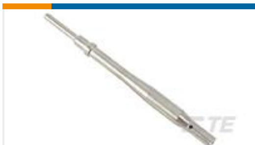
TE 产品编号0460-247-16141 PIN, SOLID, SIZE 16, 16-20AWG, EXT, NI