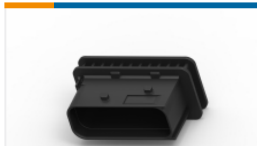
TE 产品编号2112303-1 PROTECTION CAP, FOR REC.HSG GROUP E