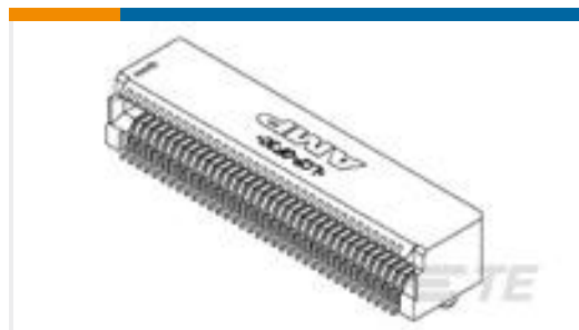
TE 产品编号1367337-1 70 POS PT CONNECTOR, X2, XENPAK, 15 AU