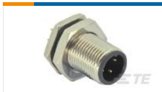
TE 产品编号1838420-1 M12 Mtl MALE PNL CONN. PCB, Fr