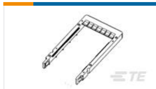
TE 产品编号1367710-1 assy guide frame x2 cast metal type 2