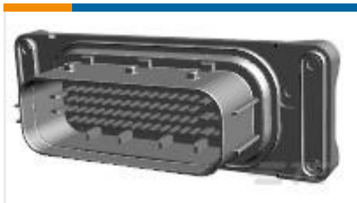
TE 产品编号2-1418362-1 62 POS MIXED HEADER CODB