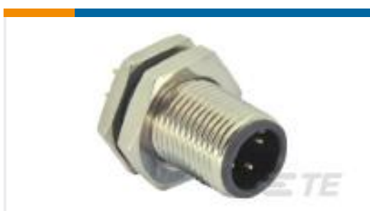
TE 产品编号1838420-3 M12 Mtl MALE PNL CONN. PCB, Fr