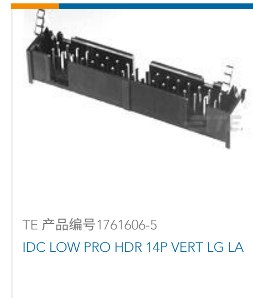
TE 产品编号1761606-5 IDC LOW PRO HDR 14P VERT LG LA