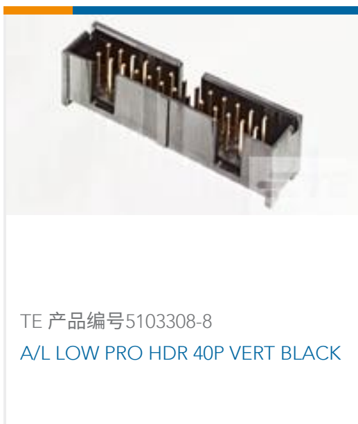
TE 产品编号5103308-8 A/L LOW PRO HDR 40P VERT BLACK