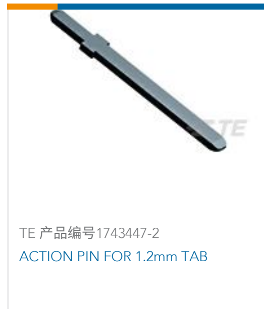
TE 产品编号1743447-2 ACTION PIN FOR 1.2mm TAB