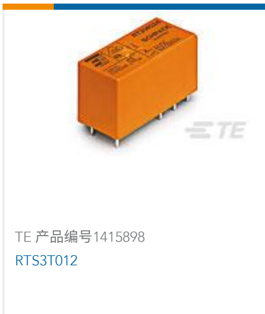
TE 产品编号1415898 RTS3T012