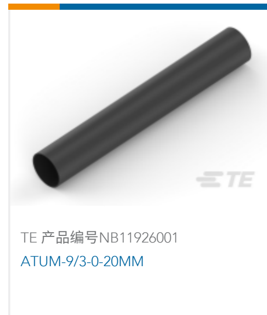
TE 产品编号NB11926001 ATUM-9/3-0-20MM