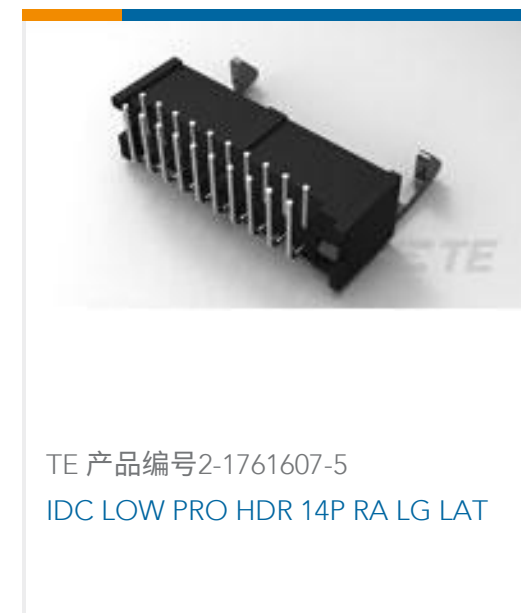
TE 产品编号2-1761607-5 IDC LOW PRO HDR 14P RA LG LAT