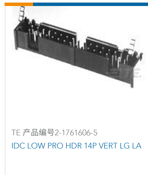
TE 产品编号2-1761606-5 IDC LOW PRO HDR 14P VERT LG LA