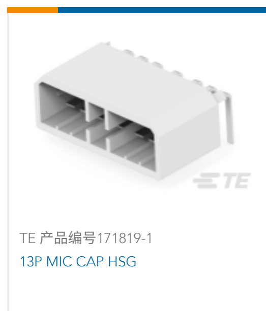
TE 产品编号171819-1 13P MIC CAP HSG