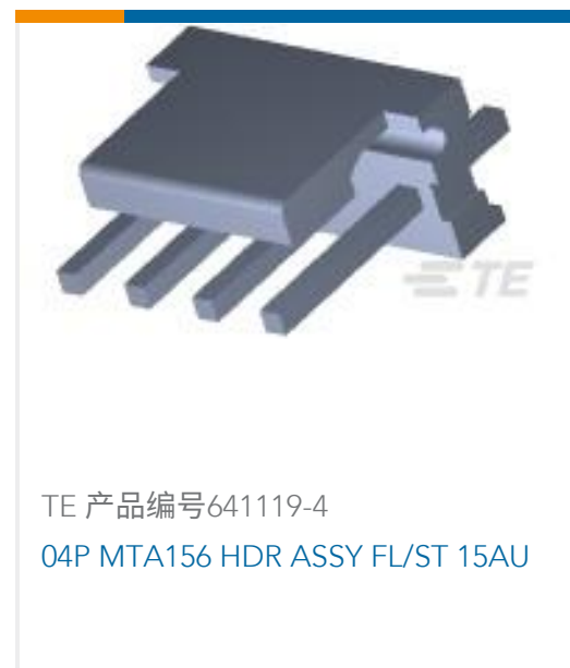
TE 产品编号641119-4 04P MTA156 HDR ASSY FL/ST 15AU