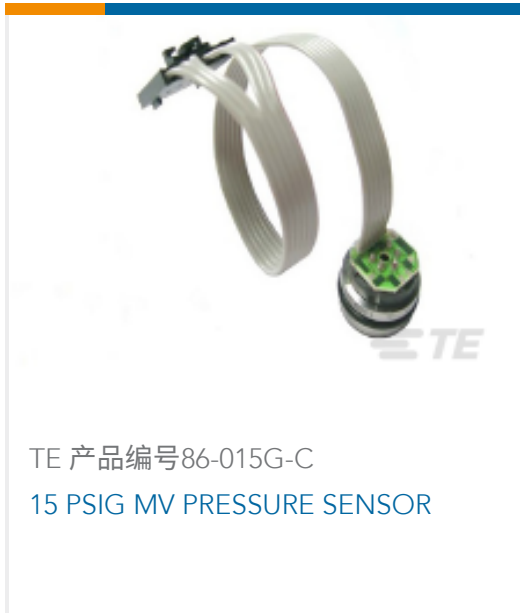
TE 产品编号86-015G-C 15 PSIG MV PRESSURE SENSOR