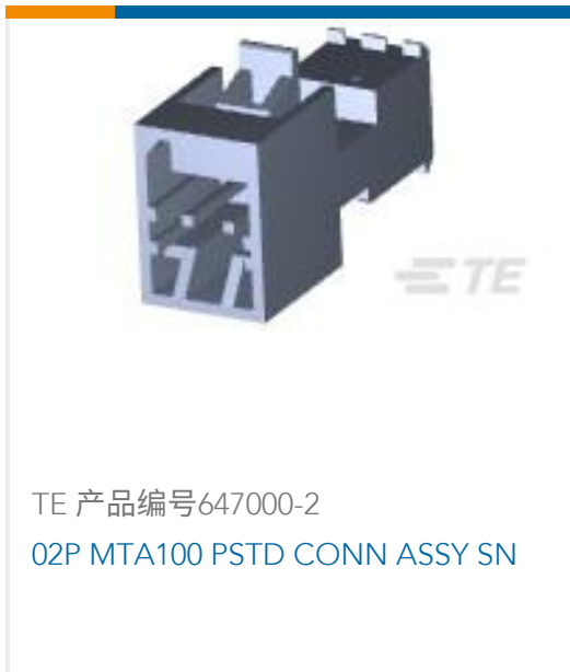
TE 产品编号647000-2 02P MTA100 PSTD CONN ASSY SN