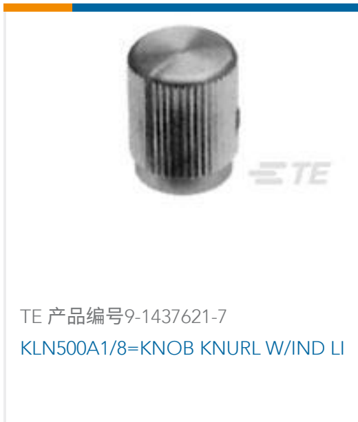
TE 产品编号9-1437621-7 KLN500A1/8=KNOB KNURL W/IND LI