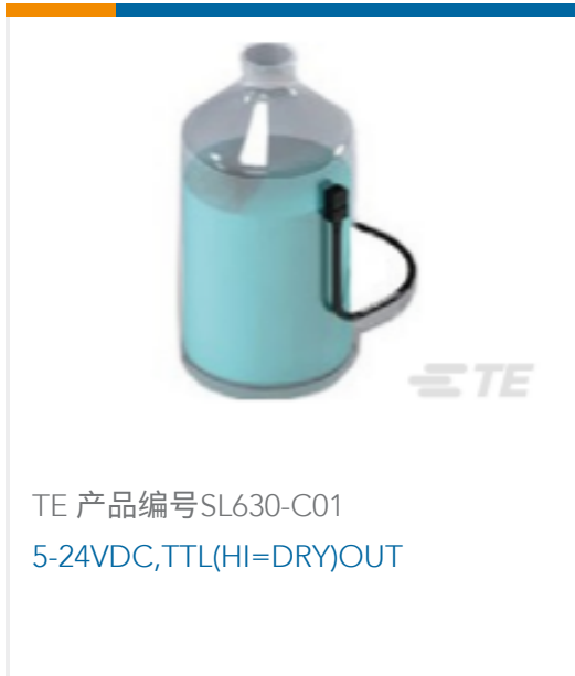
TE 产品编号SL630-C01 5-24VDC,TTL(HI=DRY)OUT