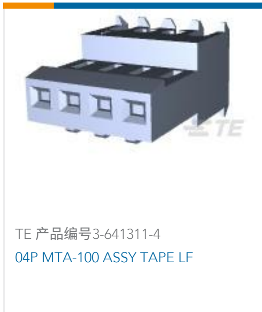
TE 产品编号3-641311-4 04P MTA-100 ASSY TAPE LF