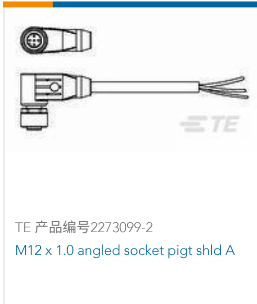
TE 产品编号2273099-2 M12 x 1.0 angled socket pigt shld A